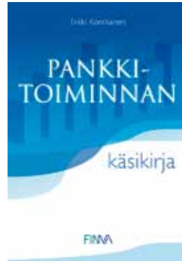
Erkki Kontkanen Pankkitoiminnan käsikirja 2011, 65 e

Vakuutus- ja rahoitusalan verkkosanakirja Vuosimaksullinen palvelu, hinta käyttäjämäärän mukaan.