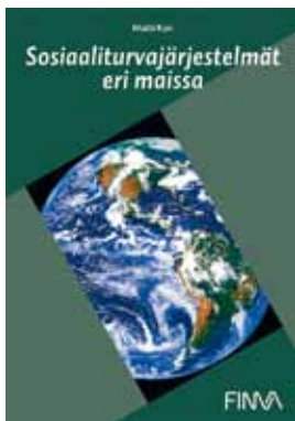
Matti Kari Sosiaaliturvajärjestelmät eri maissa 2011, 61 e

UUTTA! Verkkoaineisto itsenäiseen tai ryhmässä opiskeluun Juridiikkaa vakuutusmyyjille Mahdollisuus räätälöidä yrityskohtaisesti. Pyydä tarjous!